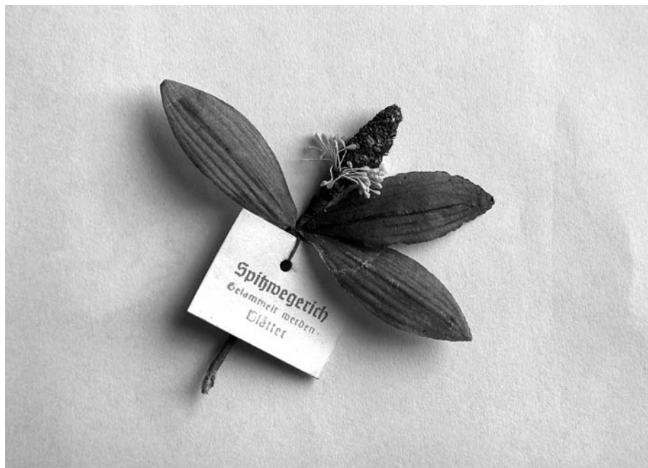
Przykładowa przypinka rozdawana w trakcie zbiórki w 1941 r. Zbiory prywatne autora

Jedna z wielu informacji o przypinkach rozdawanych w czasie zbiórki ulicznej, źródło: LT, nr 81 z 8 IV 1942, s. [5]