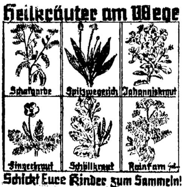
Apel „Zioła lecznicze przy drodze. Wyślij swoje dzieci do zbierania!”, źródło: LT, nr 154 z 4/5 VII 1942, s. [6]

Opisywane zjawiska łączyć należy z występującymi po 1941 r. problemami z zaopatrzeniem. Leki musiały być przede wszystkim dostarczane wojsku, a ludność cywilna otrzymywała je w ograniczonych ilościach. To właśnie dlatego ziołolecznictwo znalazło się w kręgu zainteresowania propagandy, promującej je jako substytut brakujących leków 42 . Niemiecka badaczka Caroline Schlick upatruje źródeł tej skomplikowanej sytuacji zaopatrzeniowej w przystąpieniu USA i innych krajów do wojny, a także coraz częstszych atakach lotniczych na niemieckie apteki, hurtownie i fabryki, co w efekcie wywołało spadek produkcji leków i ich mniejszą dostępność na rynku 43 .